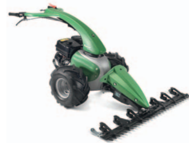
Messerbalken / Kommunalbalken